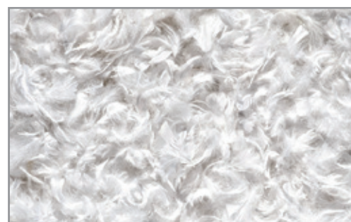
IMBOTTITURA NATURALE E LEGGERA

POSSIBILITÀ DI EFFETTUARE TOPPER SU MISURA. PREVENTIVO A RICHIESTA.